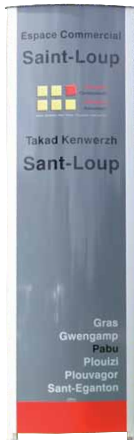
11 • Modèle GOËLAND Plat