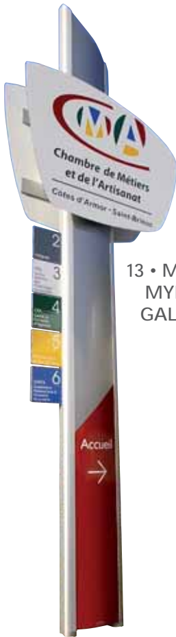
13 • Modèle MYLAN GALBÉ 2