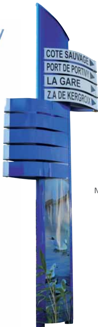
5 & 6 • Modèles IROISE