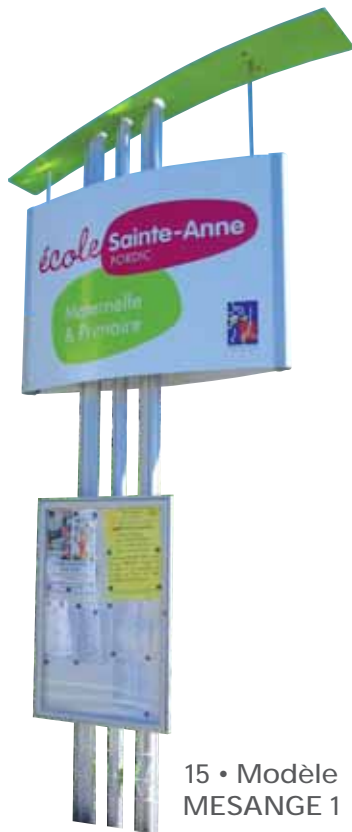
15 • Modèle MESANGE 1