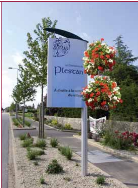
1 • Modul'Urba avec fleurissement