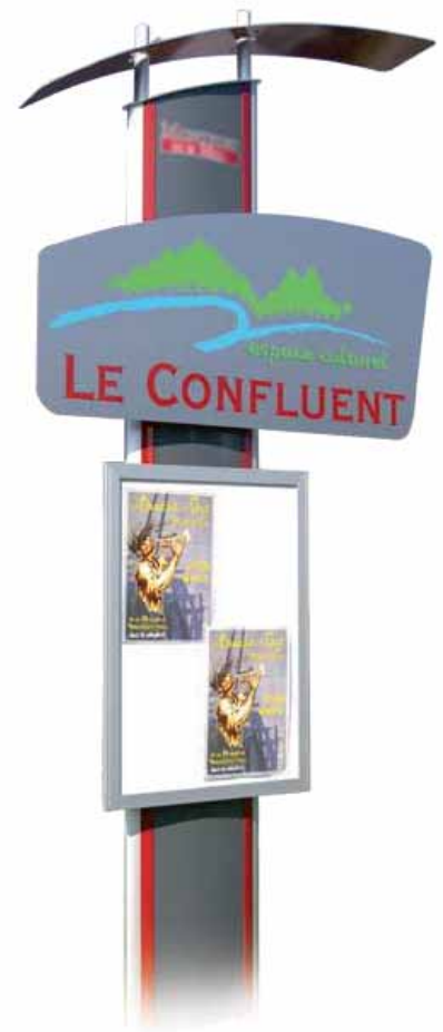
17 • Modèle MESANGE 3