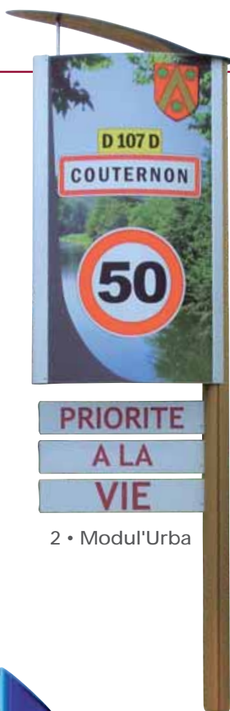
2 • Modul'Urba