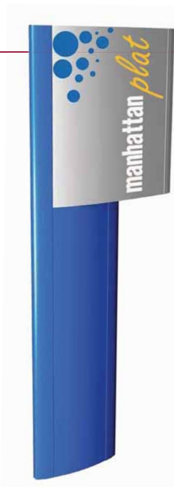
7 • Modèle MANHATTAN Plat