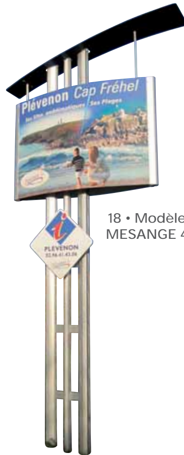
18 • Modèle MESANGE 4