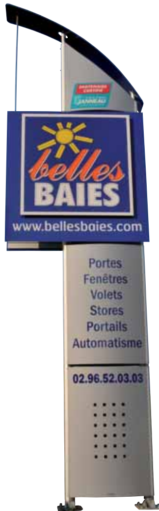
16 • Modèle MESANGE 2