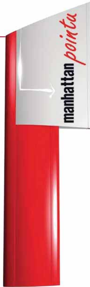
8 • Modèle MANHATTAN Pointu