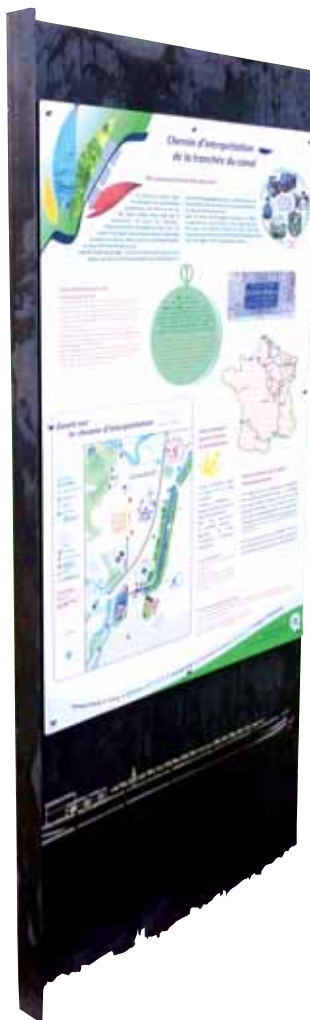
20 & 21 • Totems ACIER CORTEN Retrouvez ce mobilier dans le chapitre PATRIMOINE