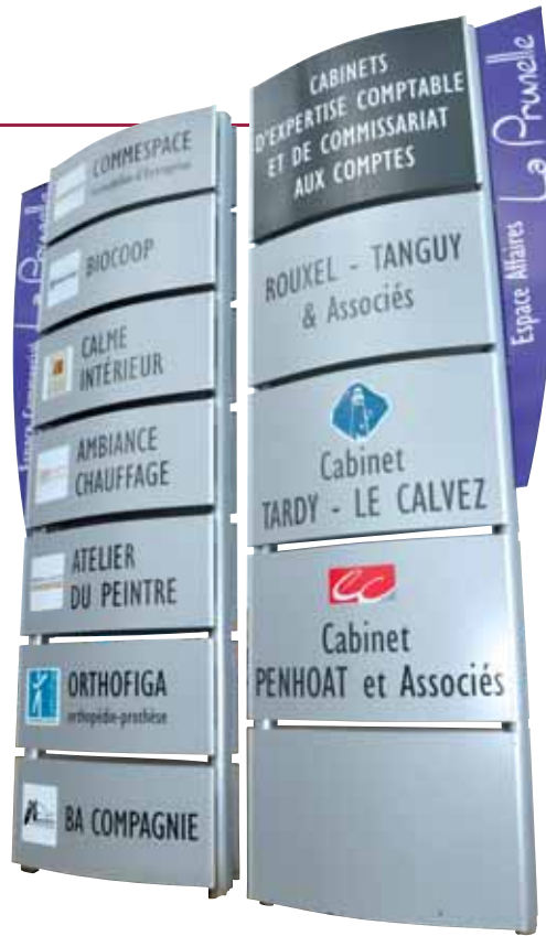
14 • Modèle AMOVIBLE