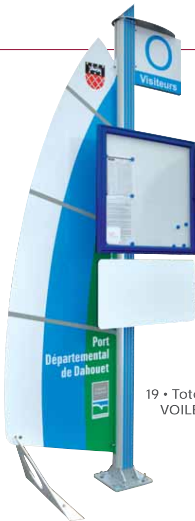
19 • Totem VOILE