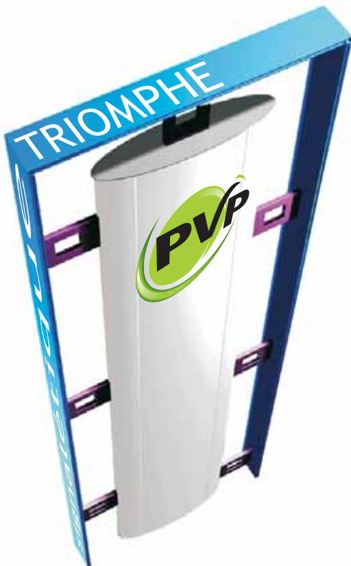
10 • Modèle TRIOMPHE