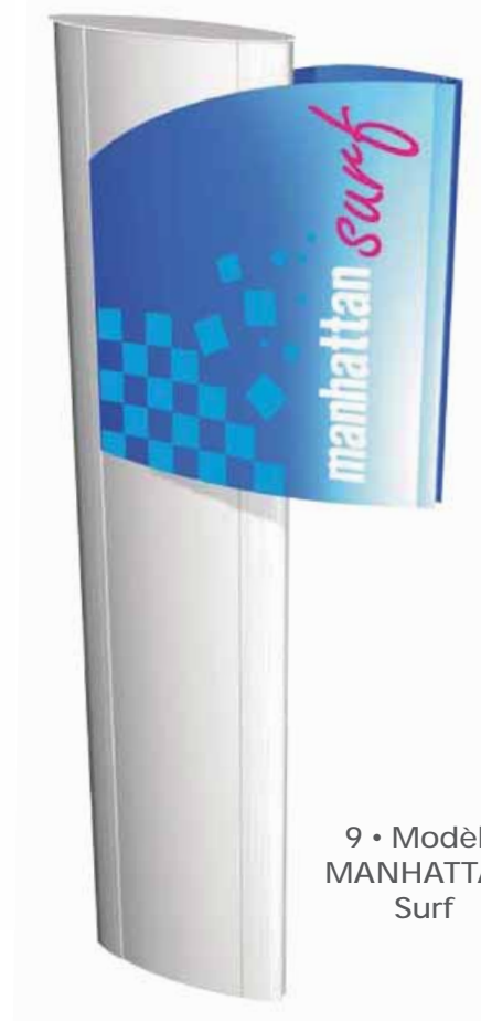
9 • Modèle MANHATTAN Surf