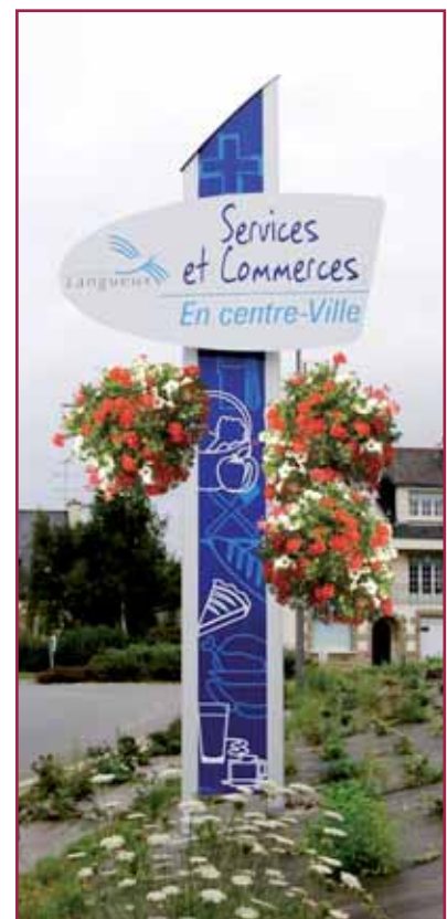
12 • Modèle MYLAN GALBÉ