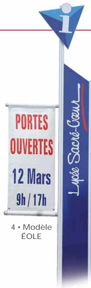
4 • Modèle ÉOLE